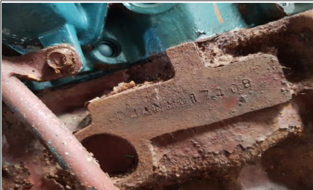
의장(2) 보조기관(크레인 유압구동용)