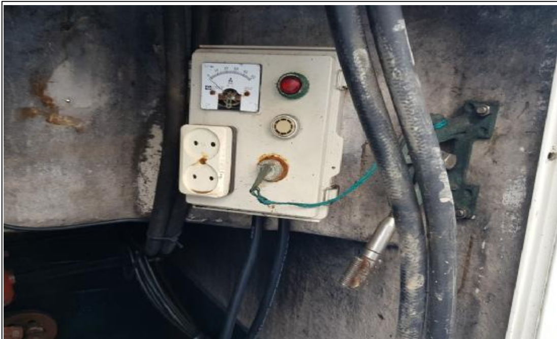
본건 선체포함 전기시설(콘트롤박스)