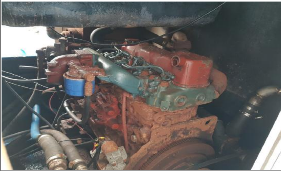
의장(2) 보조기관(크레인 유압구동용)