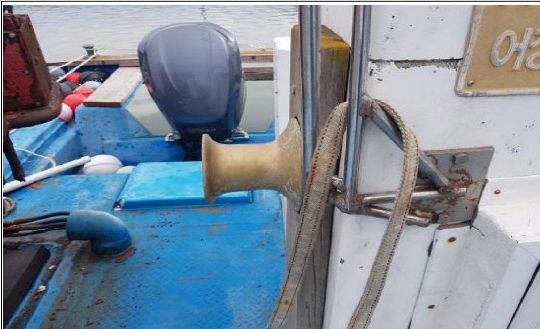
본건 선체포함 사이드로라(유압식)