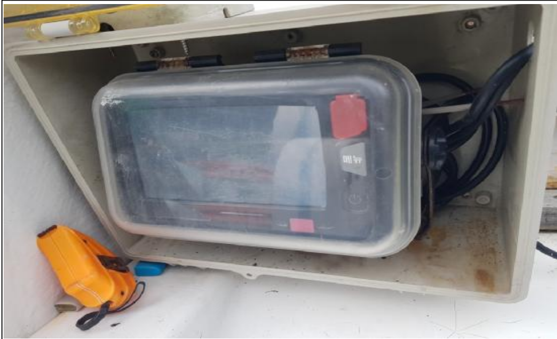
의장(3) V PASS