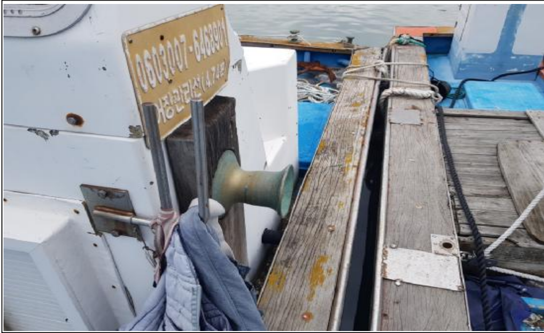
본건 선체포함 사이드로라(유압식)