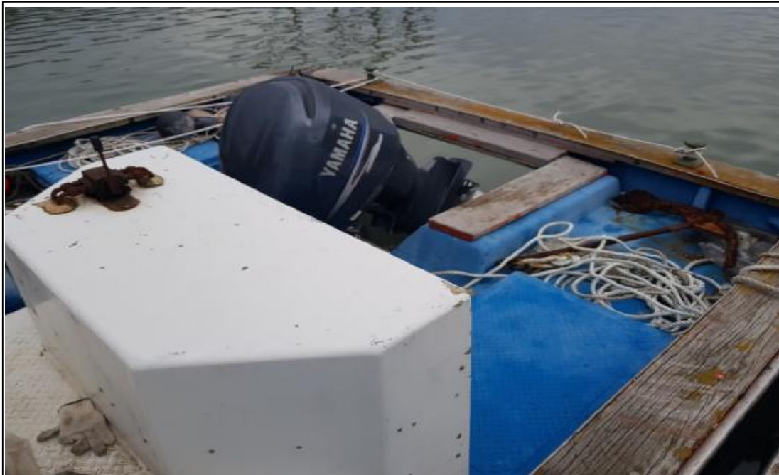
본건 선미 및 주기관