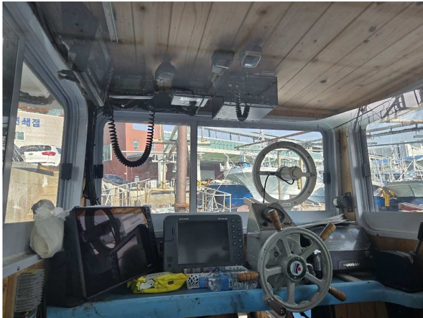
본건 조타실 내부