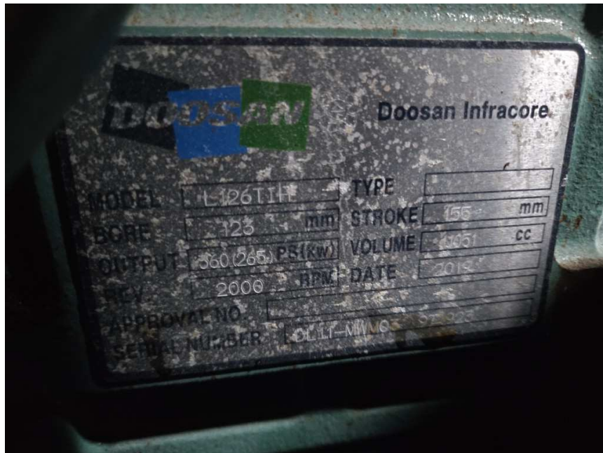
본건 기관 명판