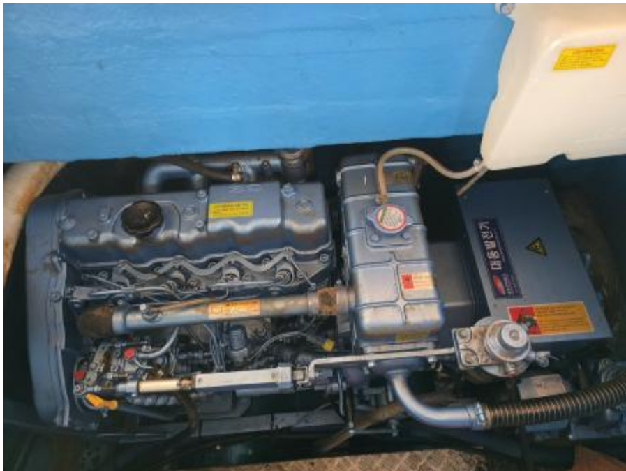
의장품(보조기관 및 발전기)