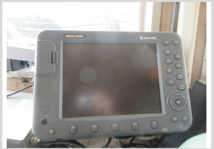
[ 2 ]