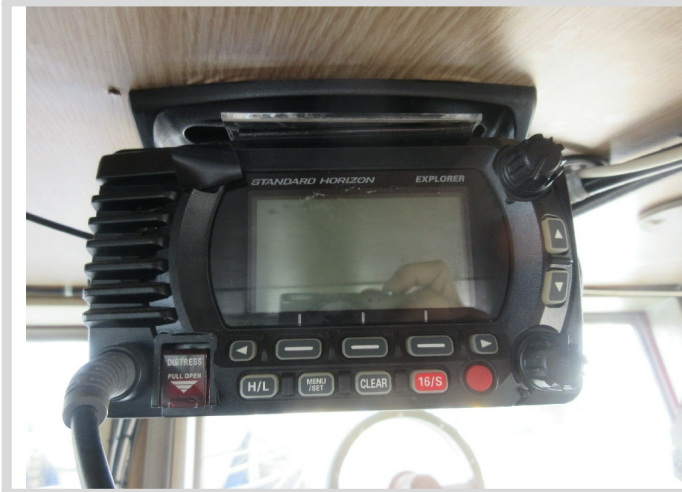
[ 5 ]