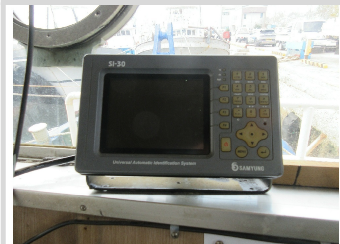
[ 3 ]