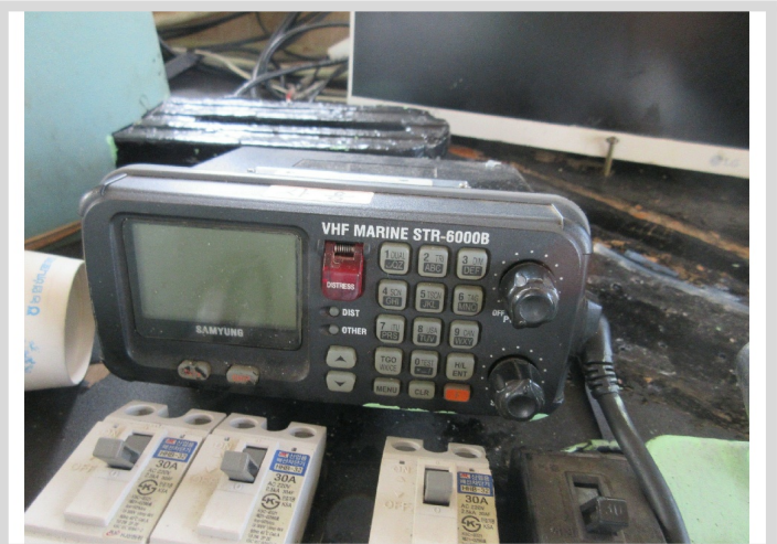
[ 4 ]