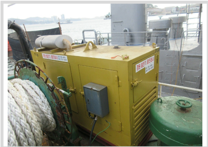
[ : ]