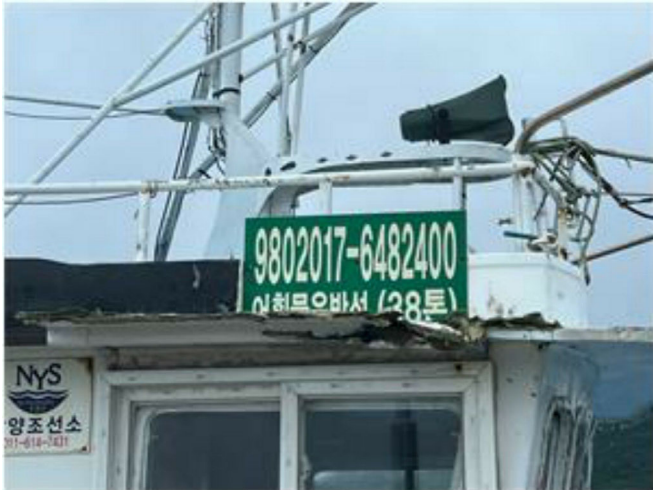
[본건 선박 - 777시내산호(표시부)]