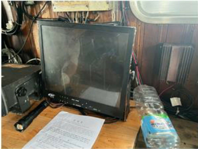
[ CCTV ]