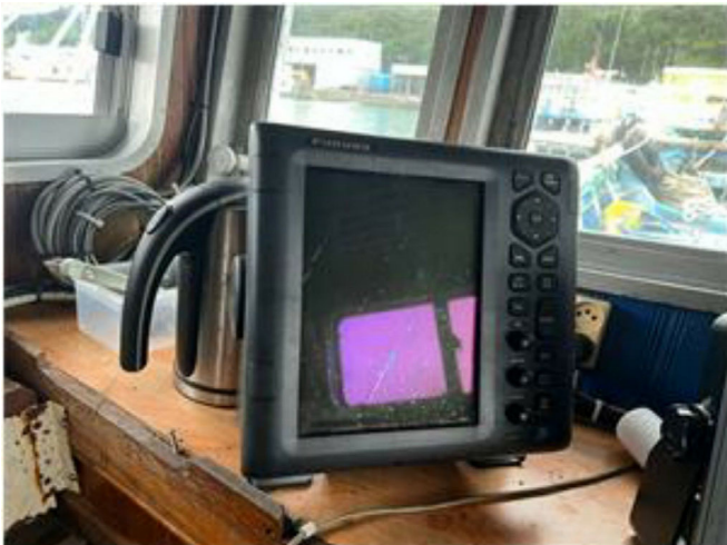
[ Radar ]