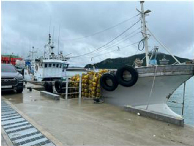
[본건 선박 - 777시내산호]