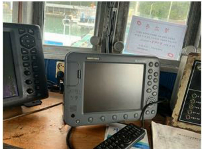
[ GPS Plotter ]