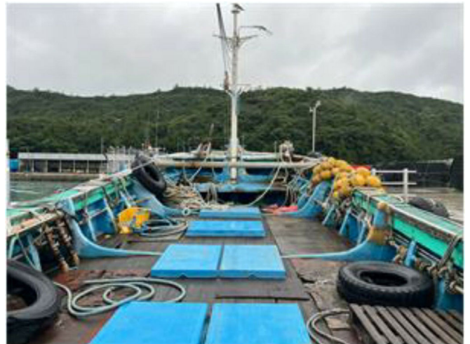
[본건 선박 - 777시내산호]