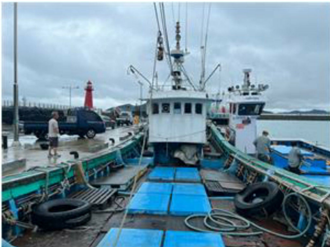
[본건 선박 - 777시내산호]