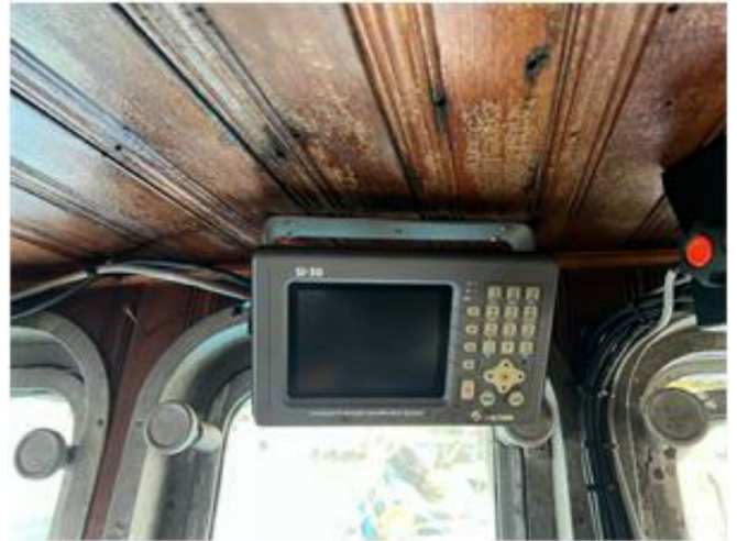
[ 조타실 ]