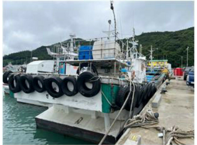
[본건 선박 - 777시내산호]