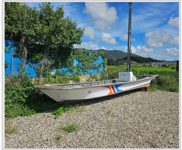
본 건 전경