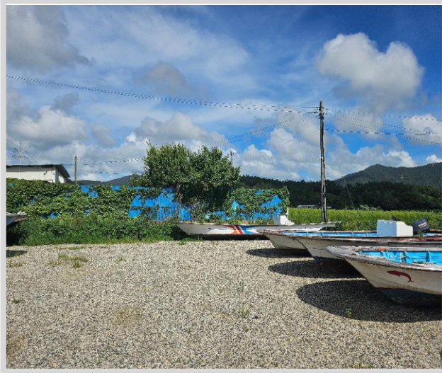
본 건 주위 환경