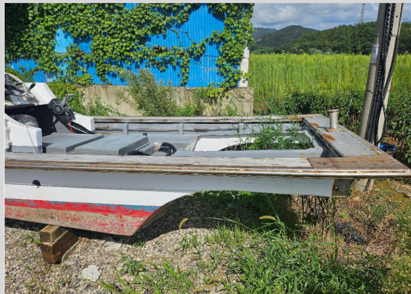
주기관 부분 소재불명