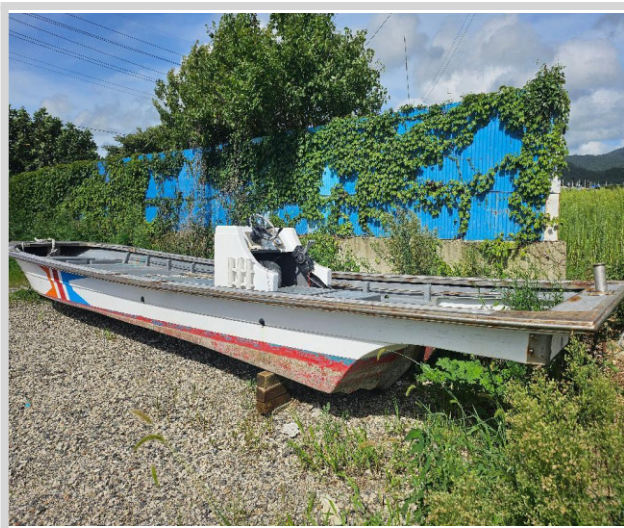
본 건 선체