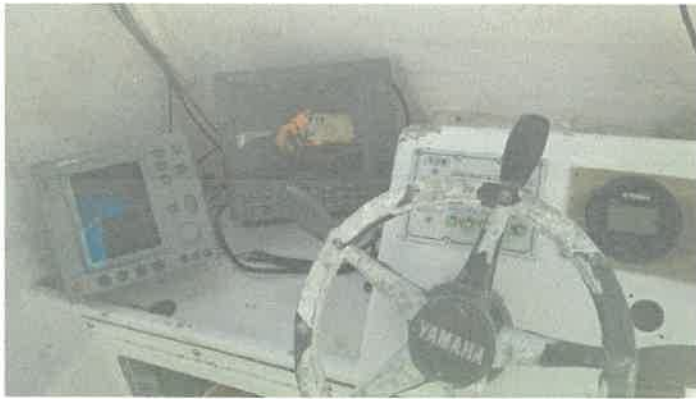
레이다 및 어군 탐지기