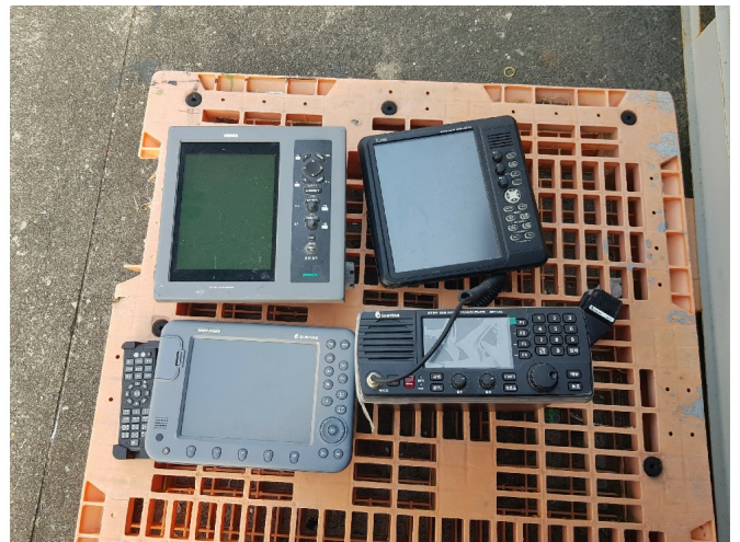
( ~ ) 158-27