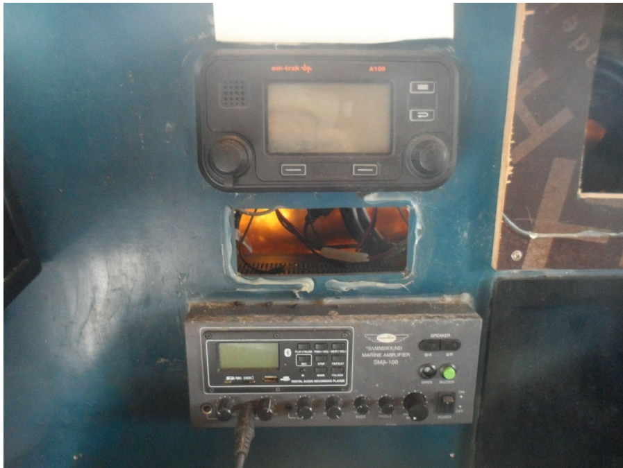
A I . S