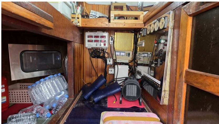
본건 조타실 전경(3)