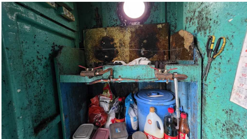
본건 선원실 내부(2)