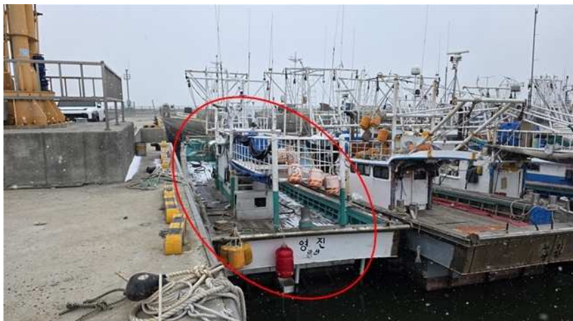
본건 후미 전경