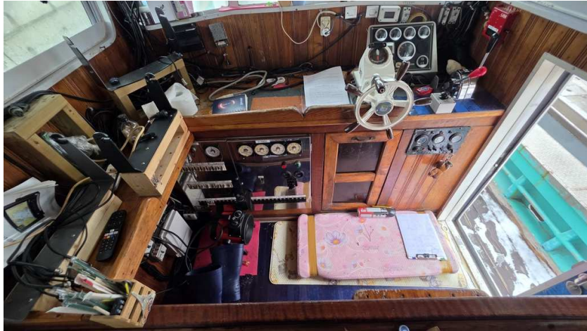
본건 조타실 전경(2)