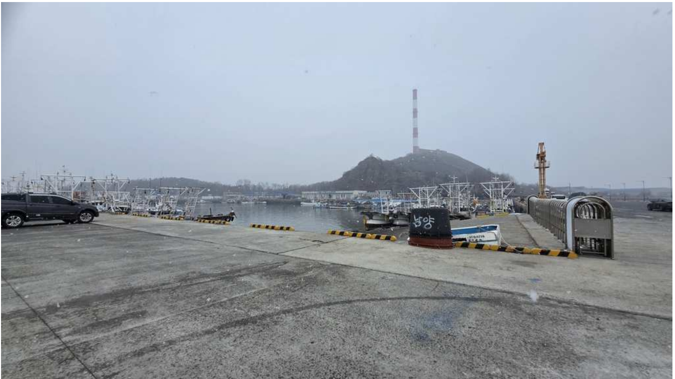
본건 계류장 전경