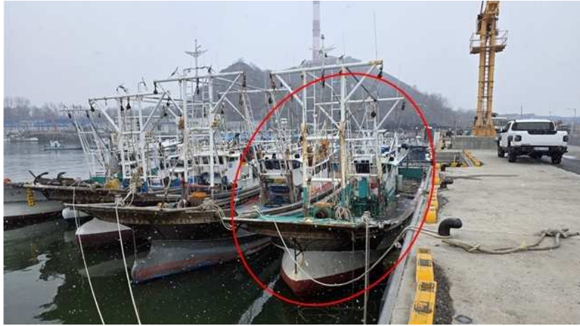
본건 선미 전경