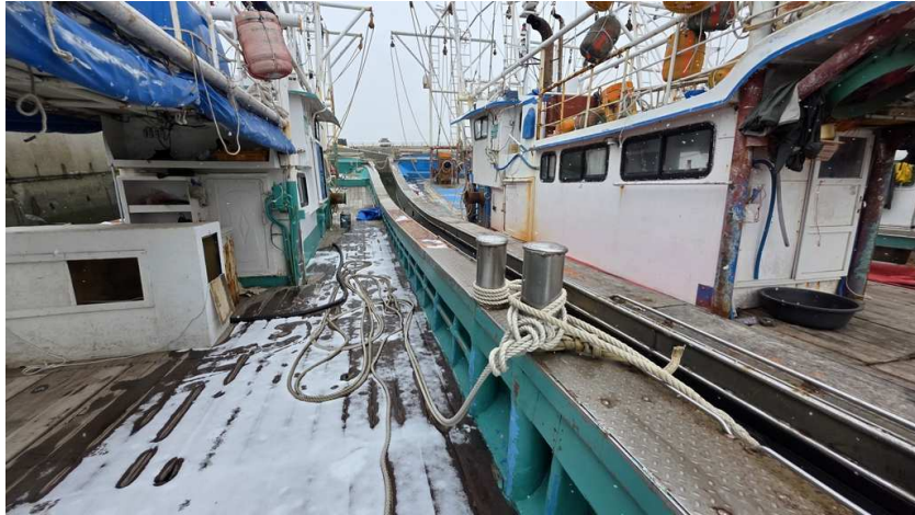
본건 선상 전경(2)