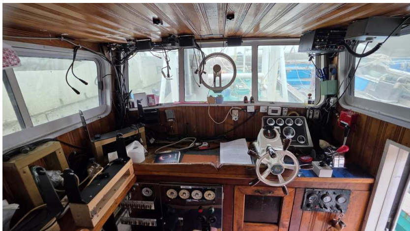
본건 조타실 전경(1)