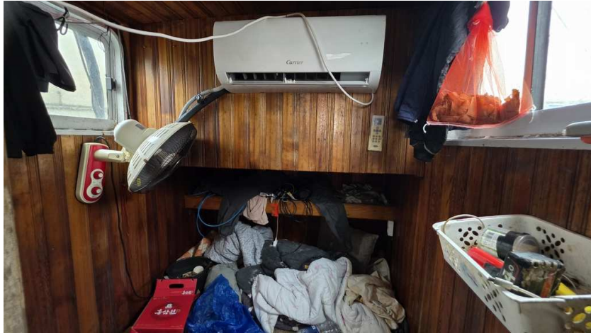
본건 선원실 내부(1)