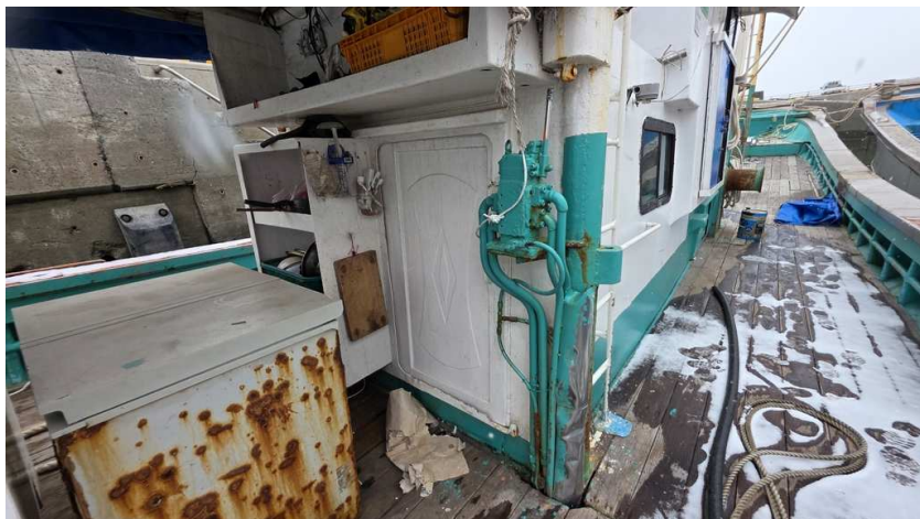
본건 선원실 입구 전경