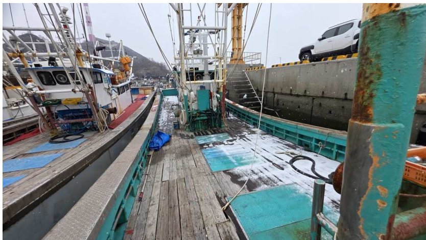
본건 선상 전경(1)