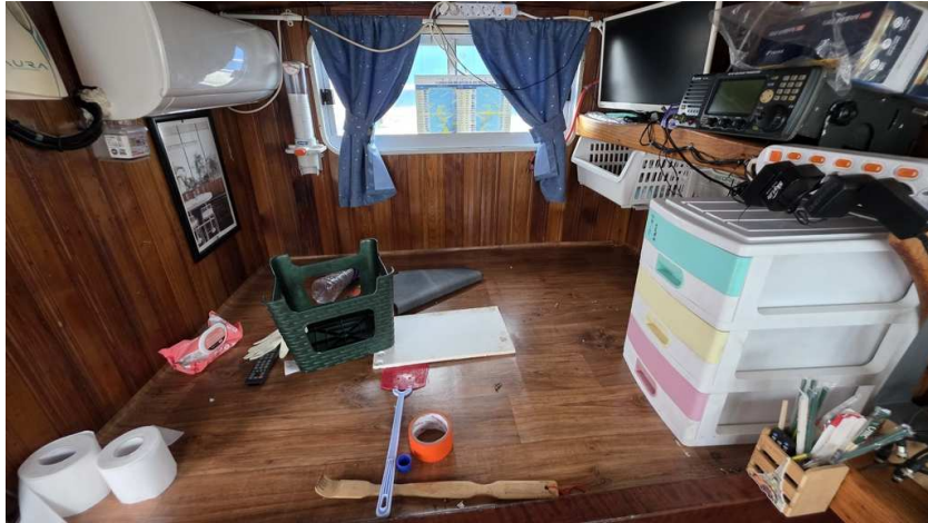
본건 선장실 전경