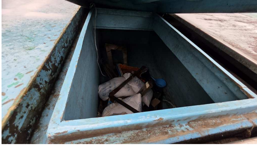
본건 선상 창고 내부 전경