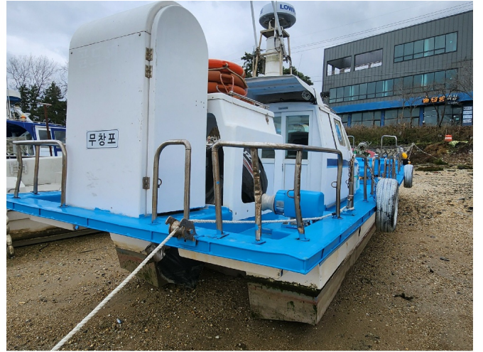
( , )