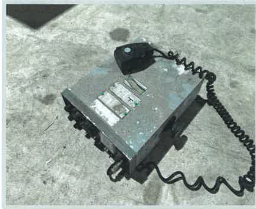
【 의장품 5) SSB TRANSCEIVER 】