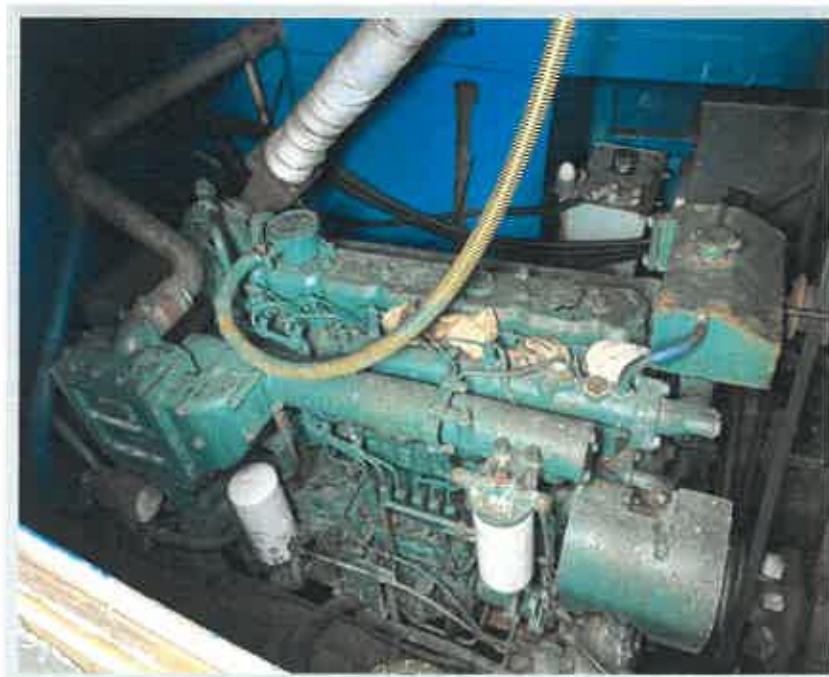
【 주기관 】