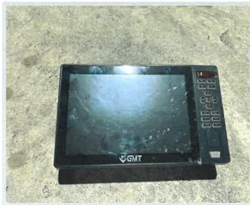
【 의장품 4) e-Navi 표시장치 】