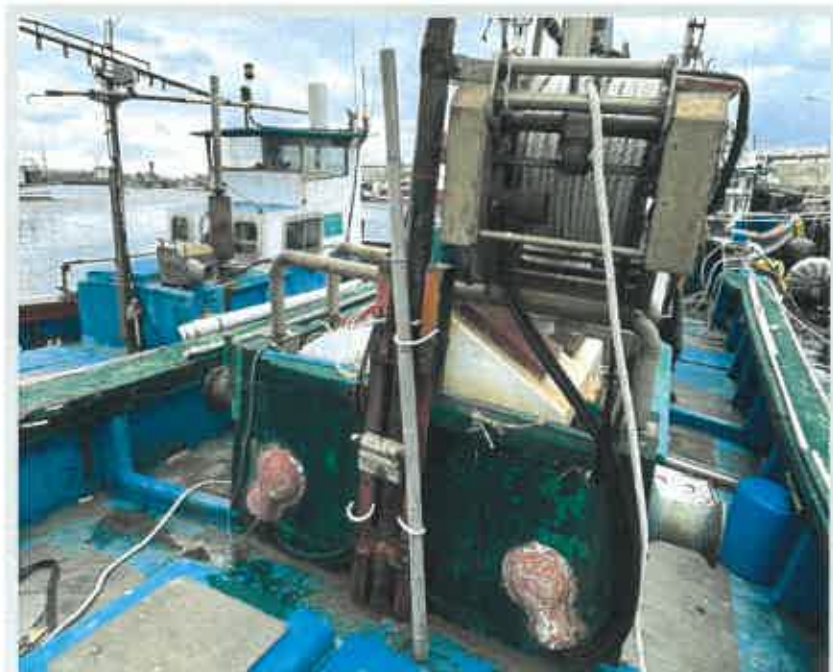
【 의장품 6) 양망기 】