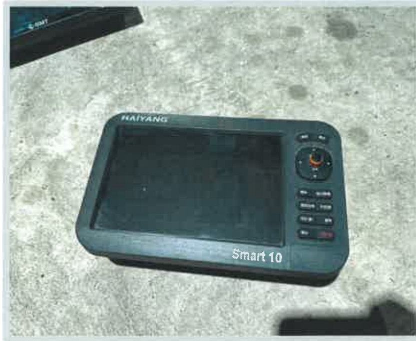
【 의장품 3) CHARTPLOTTER 】