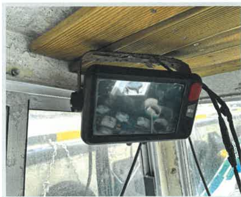
【 의장품 2) V-PASS 】