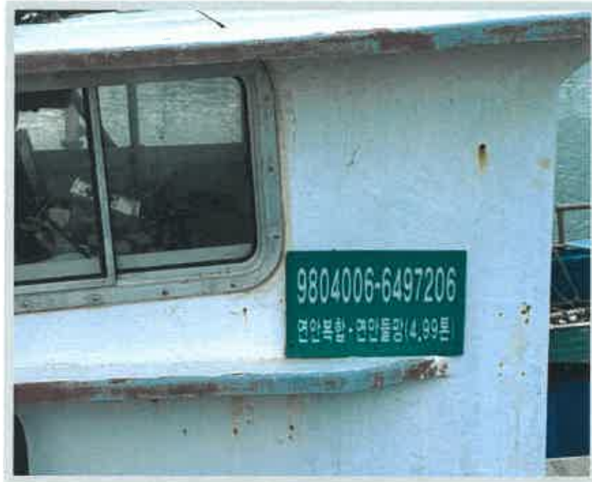
【 어선번호 】