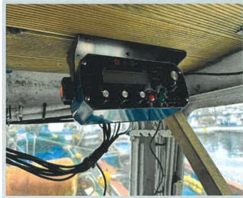
【 의장품 1) 자동조타기 】