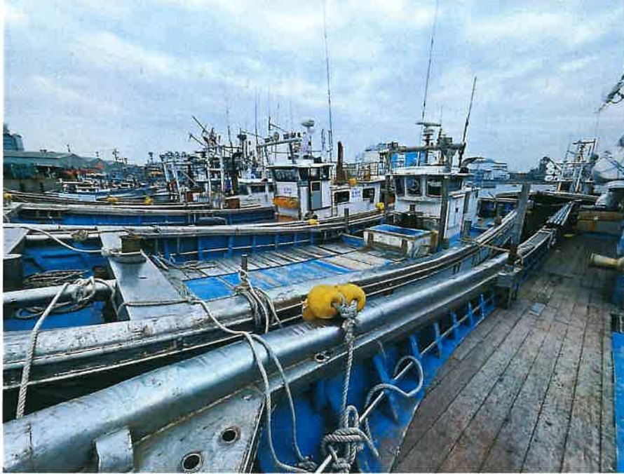
본건 선박 전경