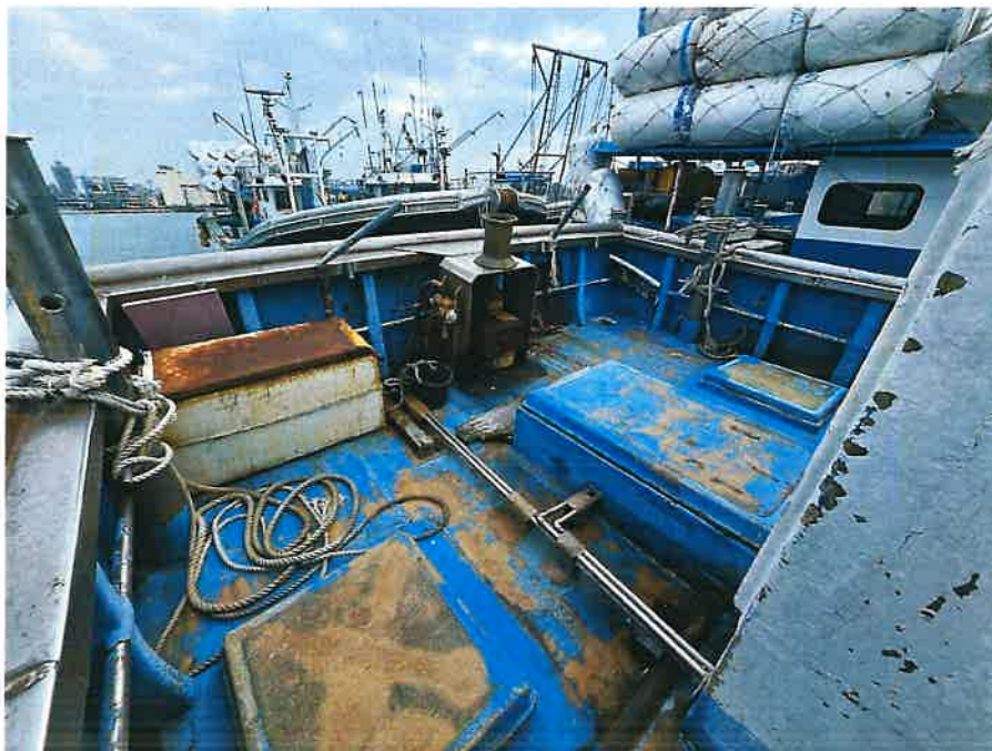
본건 선박 선미 전경