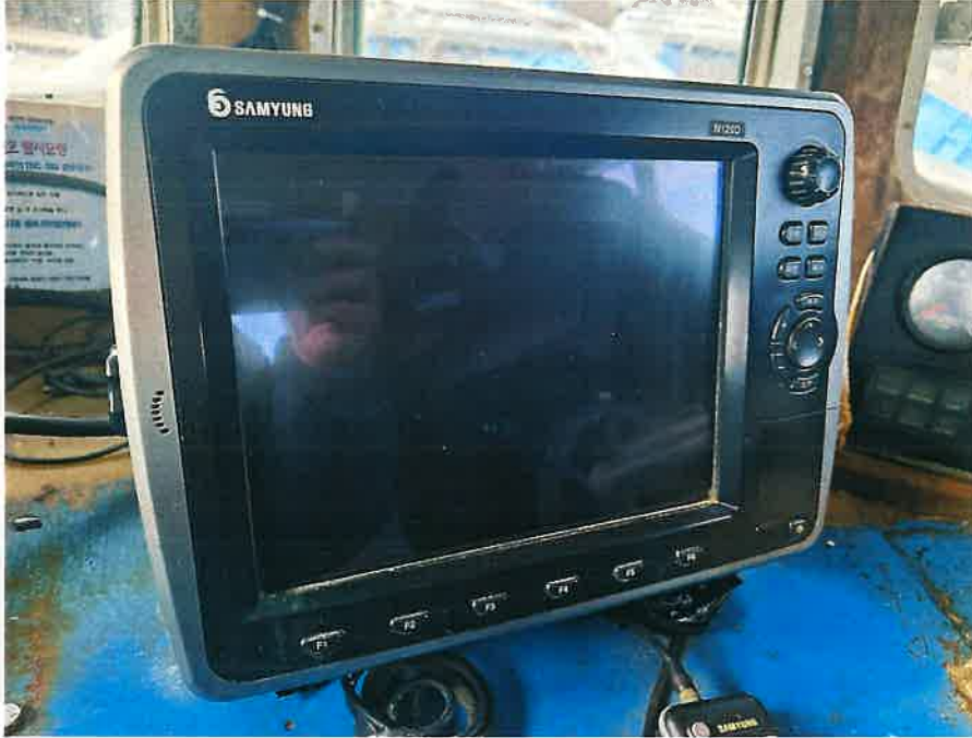
본건 선박 의장품⑤ 전경