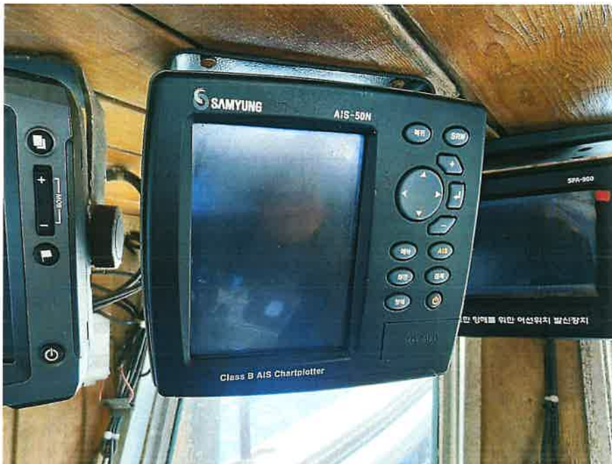
본건 선박 의장품② 전경