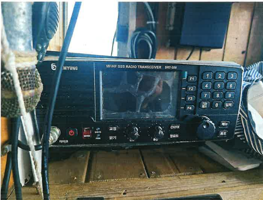
본건 선박 의장품⑥ 전경