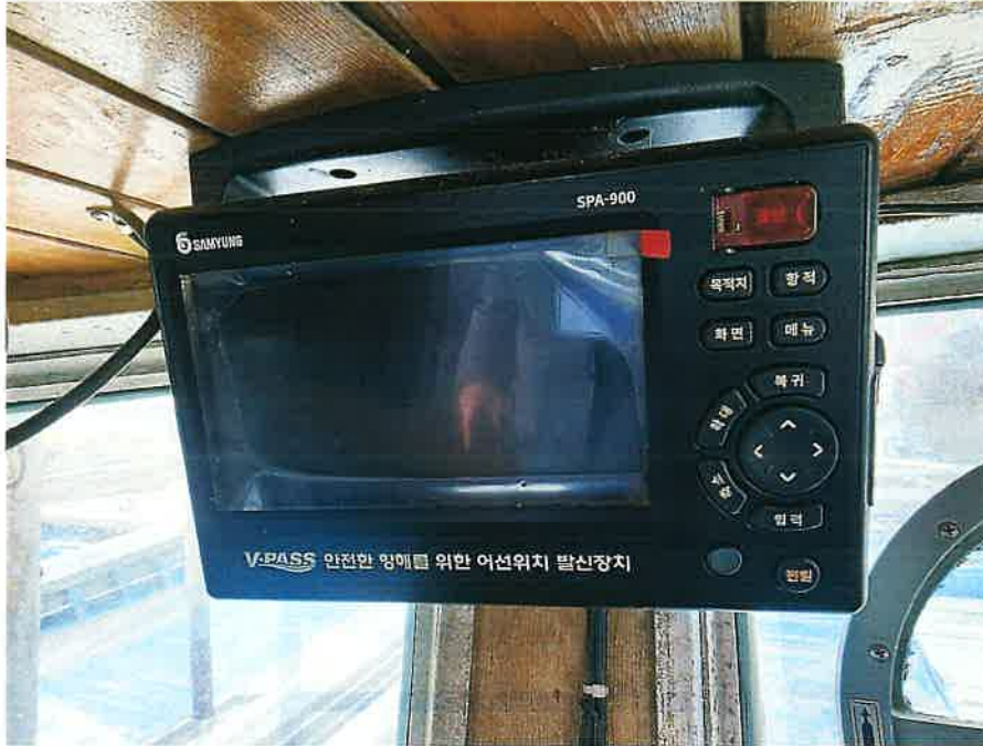
본건 선박 의장품③ 전경