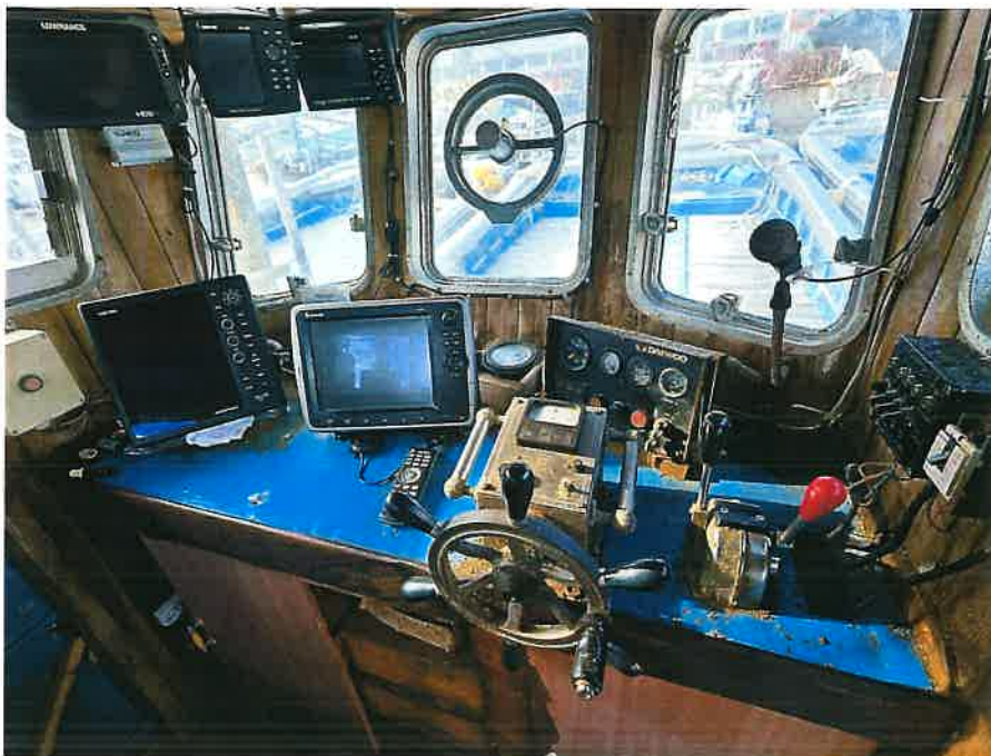
본건 선박 조타실 전경