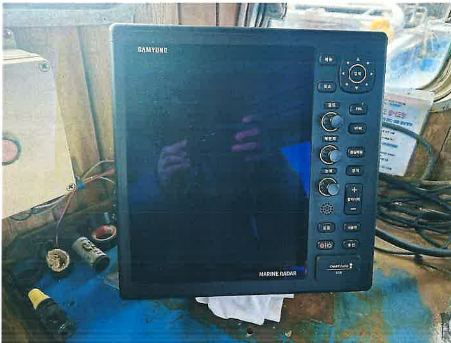
본건 선박 의장품④ 전경