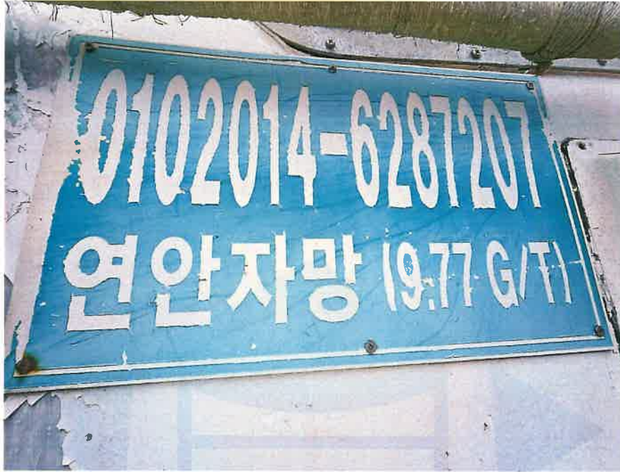
본건 선박에 부착된 어선번호