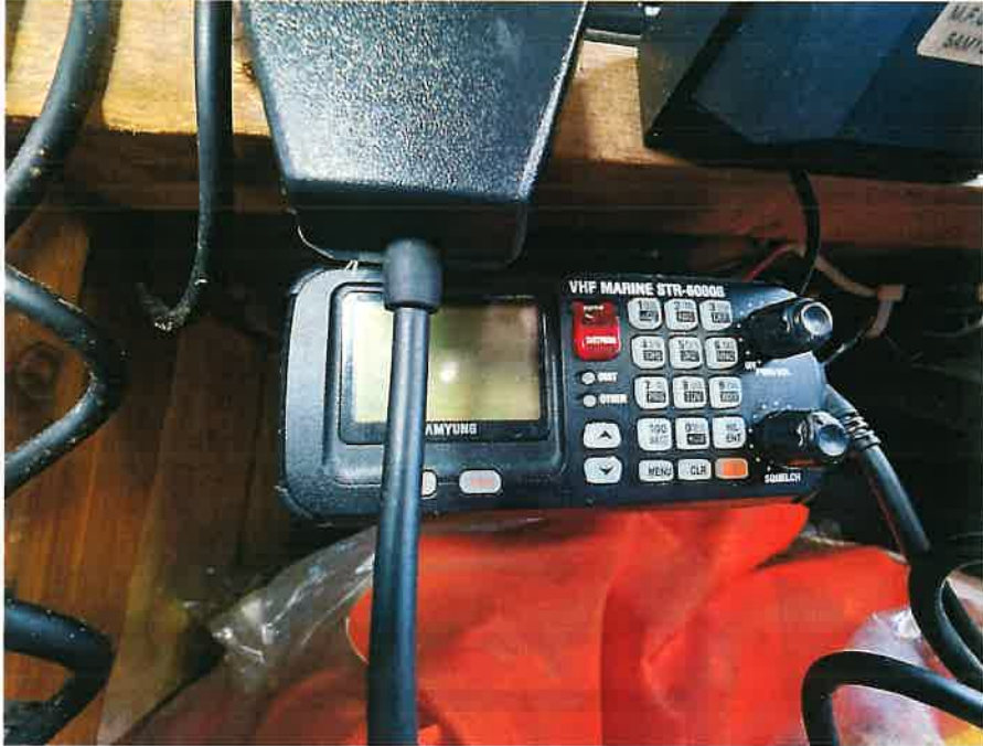
본건 선박 의장품⑦ 전경