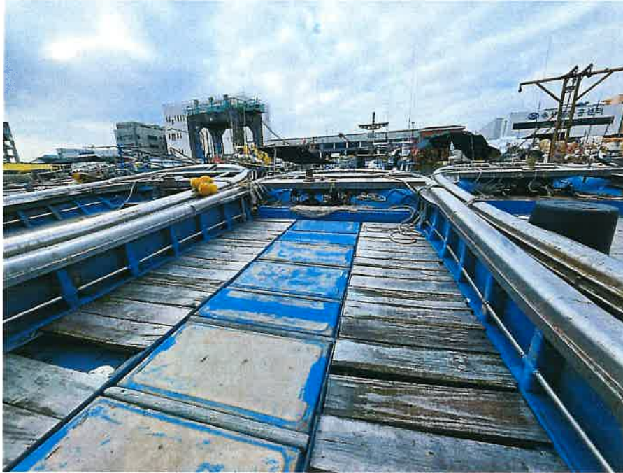
본건 선박 선수 전경