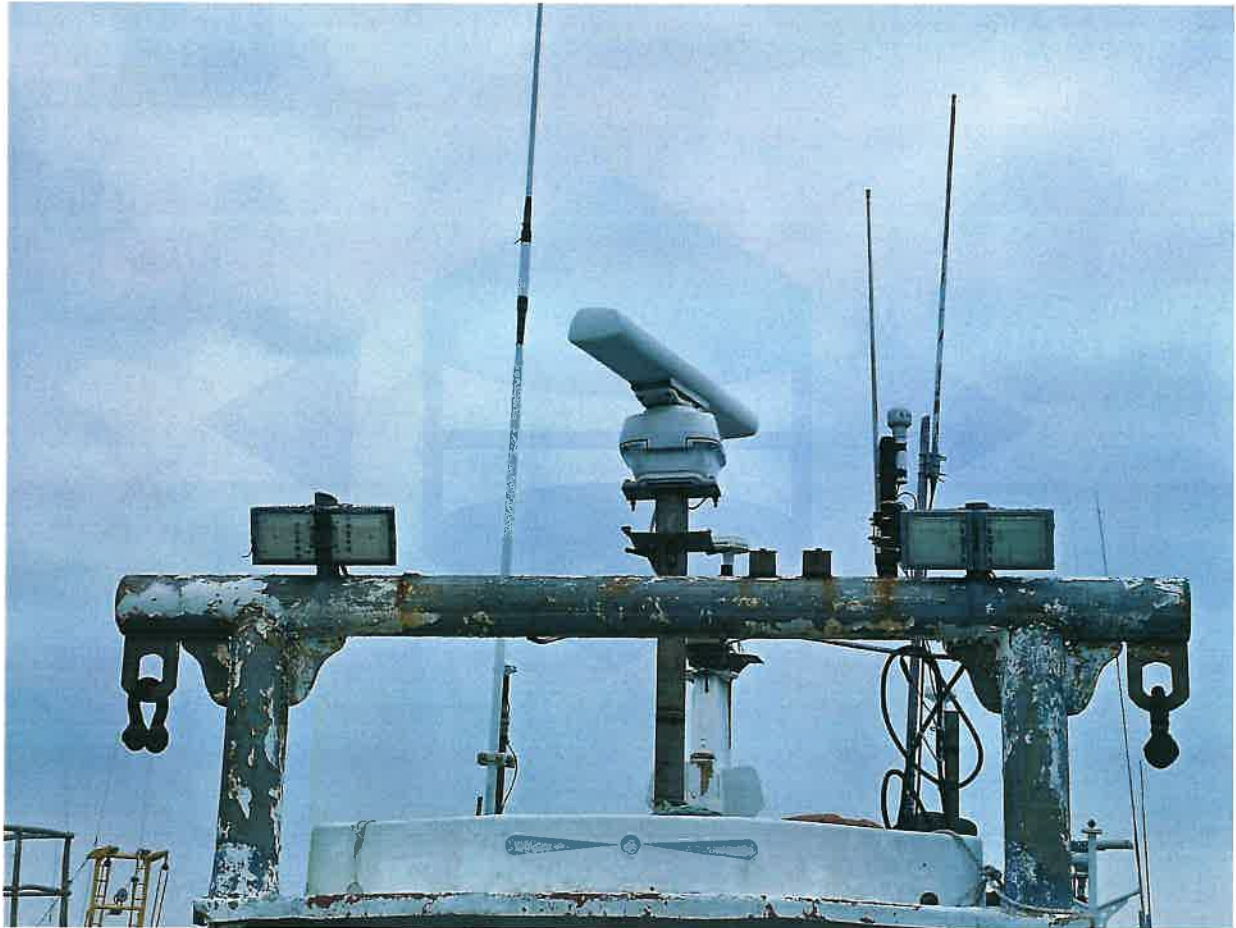
의장품 기타 부대설비 전경