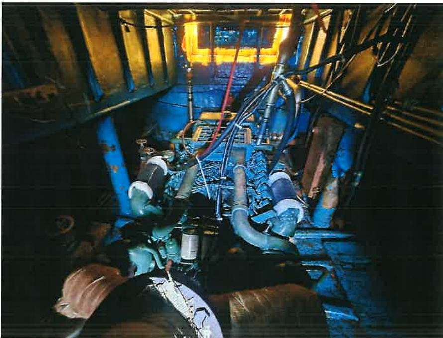
본건 선박 기관 전경