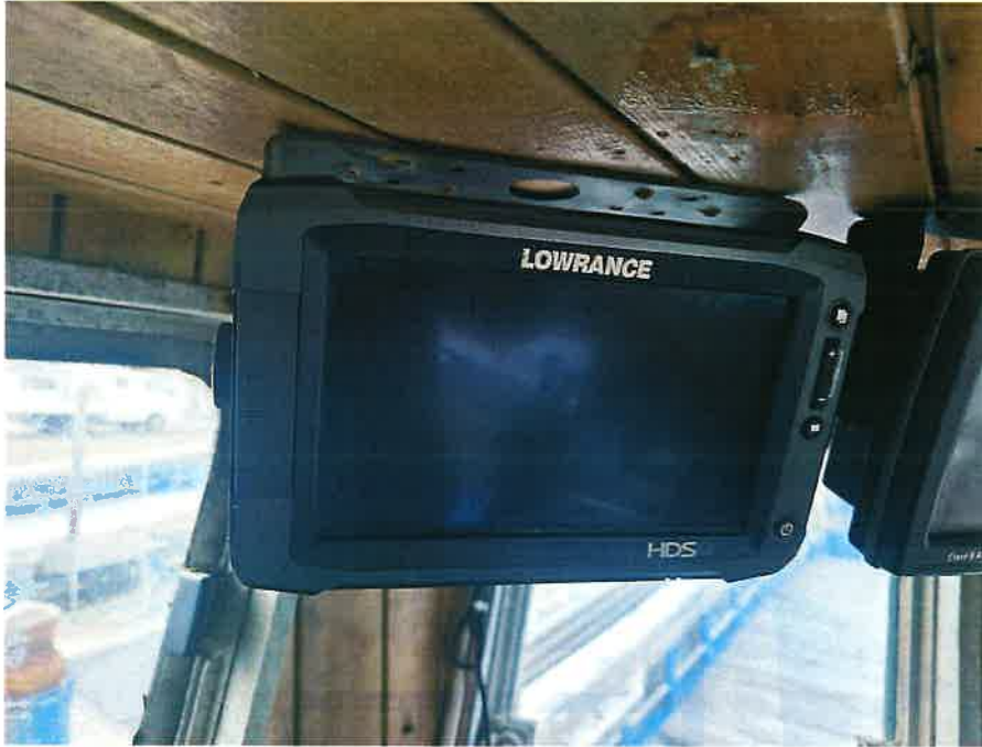
본건 선박 의장품① 전경