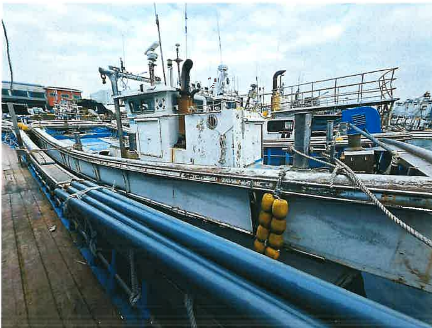
본건 선박 전경